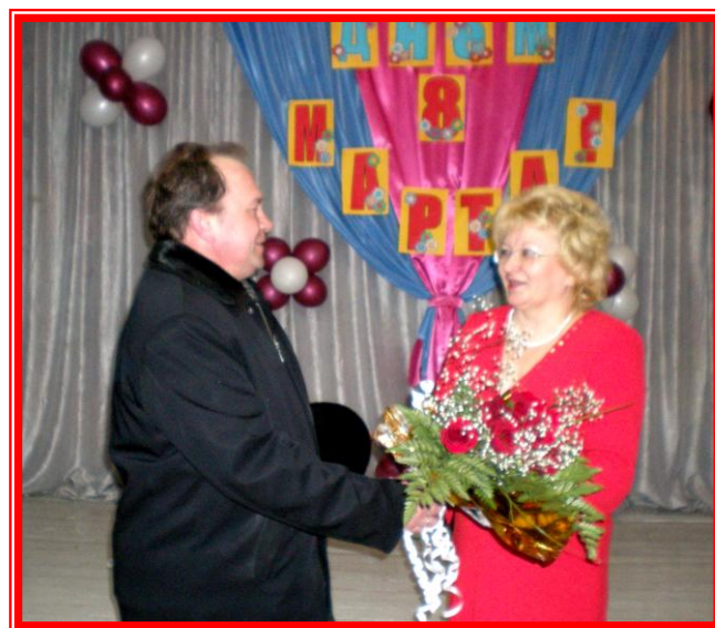
Поздравление от шефов